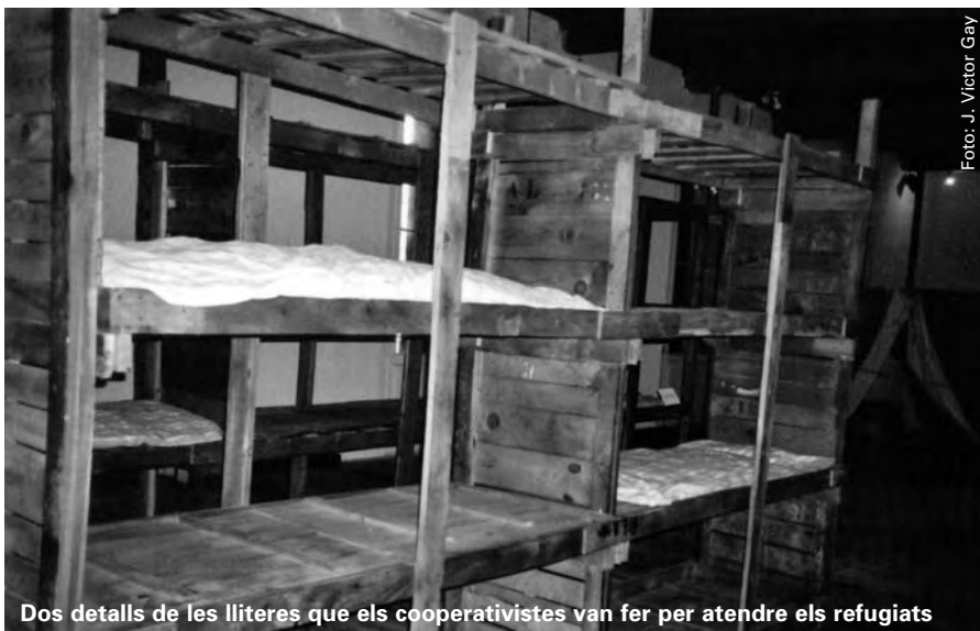
Dos detalls de les lliteres que els cooperativistes van fer per atendre els refugiats

Aquest viatge per la memòria de la Retirada ens fa retornar a la "frontera salvatge" i concretament a Sant Llorenç de Cerdans, bonica població de l'Alt Vallespir, balcó perfecte sobre la part més pirinenca de l'Alt Empordà i la vall de la Muga. Actualment té menys d'un miler i mig d'habitants i una activitat econòmica limitada a una em-