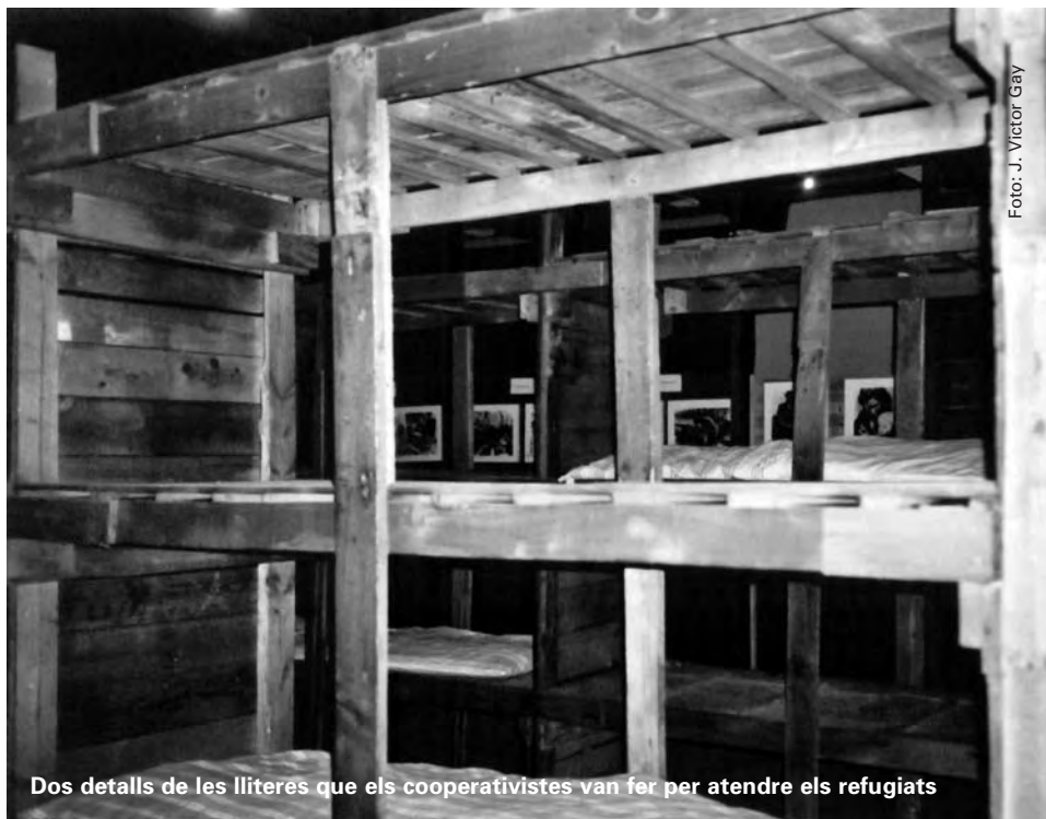
Dos detalls de les lliteres que els cooperativistes van fer per atendre els refugiats