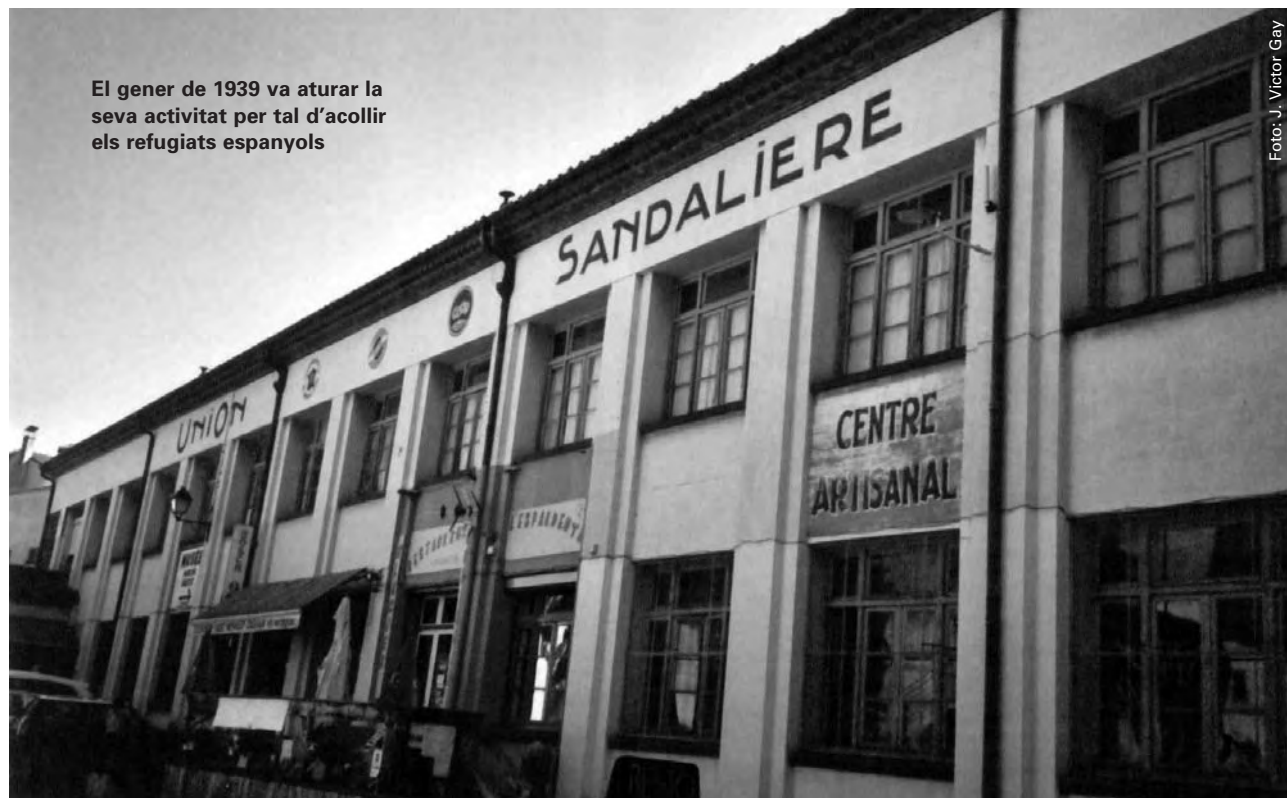
El gener de 1939 va aturar la seva activitat per tal d'acollir els refugiats espanyols